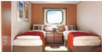
2-Bett Außenkabine 17 qm, Decks: 4, 5, 8 und 9.