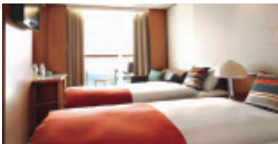
2-Bett Balkonkabine 17 qm, Decks: 8 und 9, Balkongröße: 5 qm.